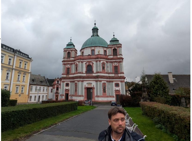
Jablonné v Podještědí, bazilika sv. Zdislavy