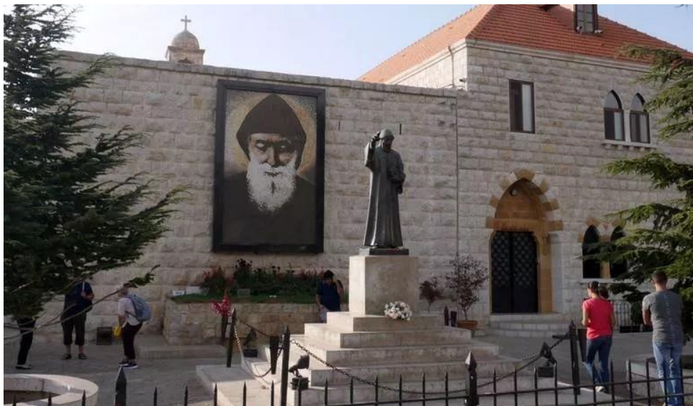
Klášter sv. Marona v Annayi, kde žil a je pochován sv. Šarbel