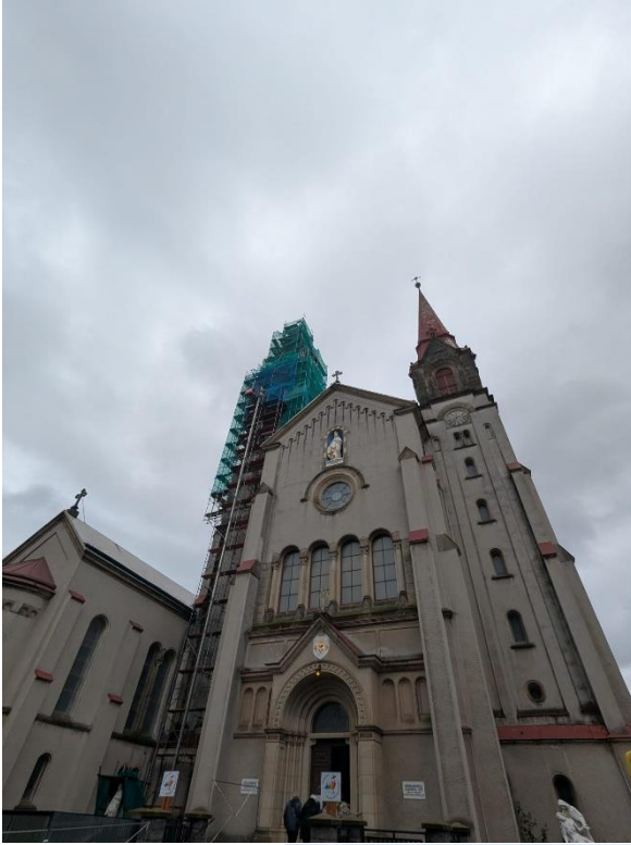
Filipov, bazilika minor P. M. Pomocnice křesťanů