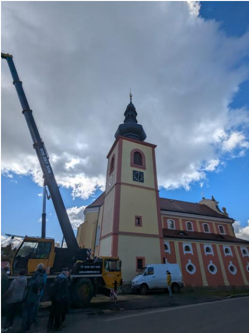
Verneřice, kostel sv. Anny, instalace zvonů do věže